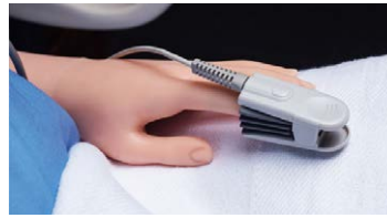
パルスオキシメーター