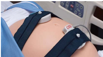
実機でのモニタリング