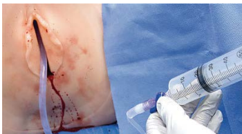
バルーンタンポナーデ